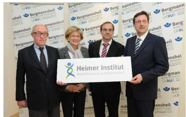
Gründung des Heimer Instituts am UK Bergmannsheil in Bochum

Außerdem haben wir die enge Zusammenarbeit mit dem Muskelzentrum am Berufsgenossenschaftlichen Universitätsklinikum Bergmannsheil GmbH in Bochum auf eine neue Grundlage gestellt: Im neu gegründeten Heimer Institut für Muskelforschung werden seit 2014 die Forschungsaktivitäten der Neurologischen Klinik gebündelt und die Behandlung muskelkranker Menschen weiter entwickelt.