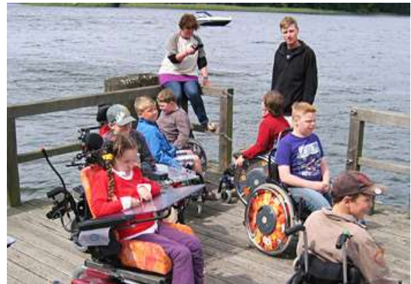
Ferienfreizeit des Sommeraufbruch e.V., unterstützt durch die heimer stiftung

Schulklassen finanzielle Hilfe für ihre Vorhaben anbieten.